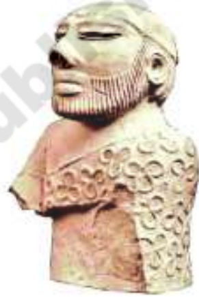
شکل 20.1 ایک اہم شخص کا اوپری دھڑ۔ وہ پجاری یا حکمران تھا