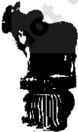
شکل 20.7 سائڈ۔ رام پورا

بعد میں دھات کے مجسموں کا فن مہاراشٹر میں پھیل گیا۔ کھدائیوں کے دوران بعض دکش کانسے کے مجسمے برآمد ہوئے۔ انہیں غالباً تین ہزار سال پہلے بنایا گیا تھا۔ کیا وہ کھلونے تھے؟