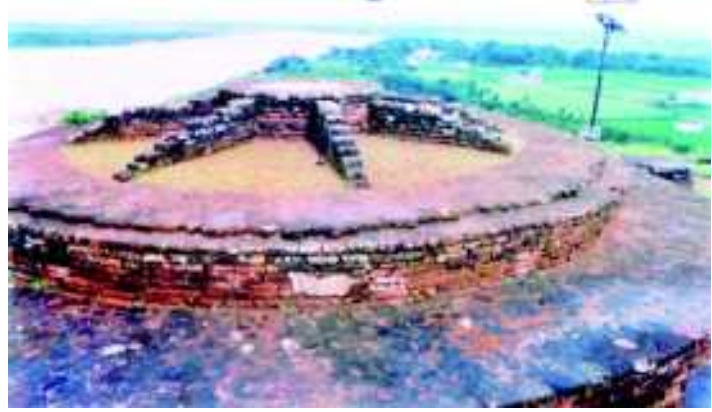
شکل 20.10 شمالی ہندن کی باقیات