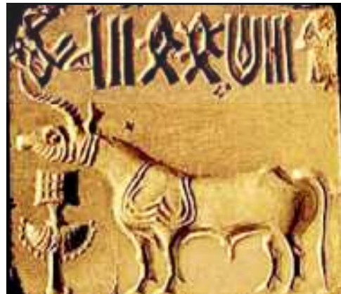
شکل 20.2 ہڑپہ کی ایک خوبصورت مہر۔ سائنڈ کو دکھلاتے ہوئے۔