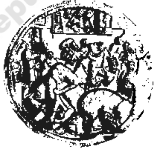
شکل 20.13 امراتی سے تصویروں کی ایک تختی

وقت گزرنے کے ساتھ سنگ تراشوں نے بڑی اور مکمل تصویریں بنانی شروع کیں۔ گوتم بدھ کے بڑے مجسموں سے لوگوں کو پُر امن، خاموش اور ایک متین شخصیت کا پتہ چلا۔