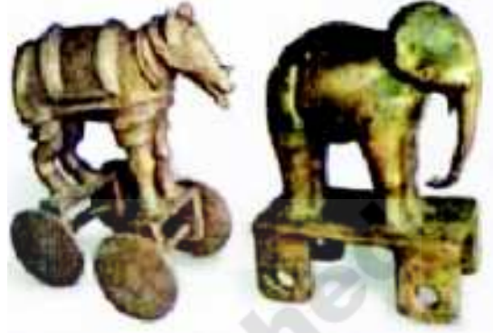
شکل 20.5 ڈیما آباد کے کانسے

بعد میں دھات کے مجسموں کا فن مہاراشٹر میں پھیل گیا۔ کھدائیوں کے دوران بعض دکش کانسے کے مجسمے برآمد ہوئے۔ انہیں غالباً تین ہزار سال پہلے بنایا گیا تھا۔ کیا وہ کھلونے تھے؟