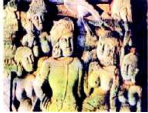
شکل 20.8 حالیہ دریافتیں

کرناٹک کے کنگنا حالی میں حالیہ دریافتوں سے فرمانروا اشوک کی ایک پتھر کی تصویر برآمد ہوئی ہے اُس پر برہمی حروف کا ایک کتبہ ہے۔ ”رانی اشوک“ (اشوک بادشاہ)۔ آپ کو یاد رکھنا چاہیے کہ یہ اشوک کی وفات کے 300 سال بعد بنایا گیا۔ شاید اسی وجہ سے اس سے مشابہت نہیں پائی جاتی۔