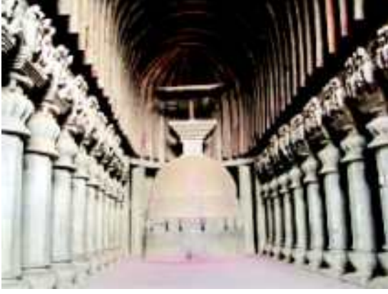
شکل 20.17 چیتیا کے اندر