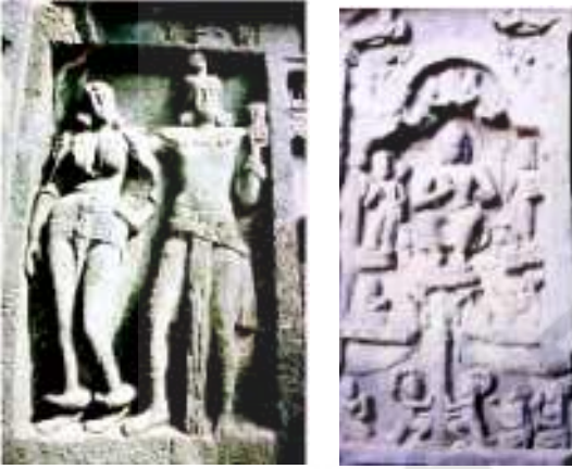
شکل 20.18 و شکل 20.19 مجسمے۔ کارلے