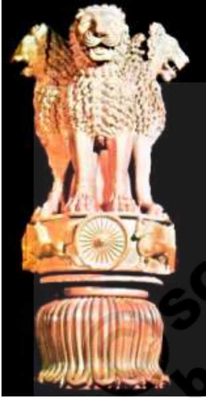
شکل 20.6 شیروں کا سر۔ سارناٹھ

یہ ستون اور شیروں کا سرموریا حکمرانوں کی طاقت اور شان و شوکت کی نمائندگی کرتے ہیں۔ ان سروں کا رام پورا کے سائڈ کے سر سے تقابل کیجیے؟ یہاں آپ دیکھ سکتے ہیں۔ کہ سائڈ زیادہ اصلی اور پرسکون دکھائی دیتا ہے۔ وہ ہڑپا کی مہر کے سائڈ کی طرح دکھائی دیتا ہے۔