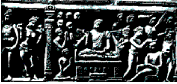
شکل 20.14 ناگر جنا کنڈے سے تختی

اس میں چھ شہزادوں اور ایک جام اُپالی کے سنگھا (جماعت) میں داخل ہونے والے منظر کو پیش کیا جا رہا ہے۔ گوتم بدھ نے شہزادوں کو انکساری کا درس دینے کے لیے اپنے اُپالی کو داخلہ دیا۔ گوتم بدھ کے بازو اُپالی ایک چھوٹی سی میز پر بیٹھا ہوا ہے۔ آپ دیکھ سکتے ہیں۔