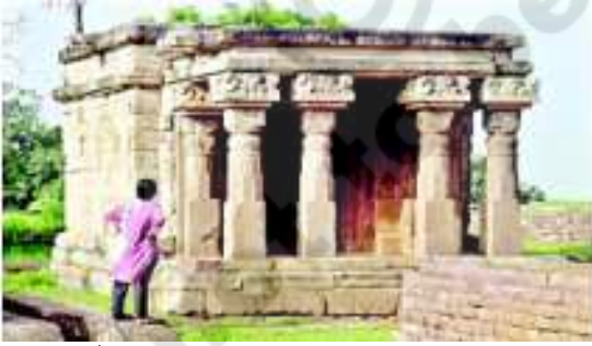
شکل 20.19 قدیم بدھ مت کا مندر۔ ساپچی