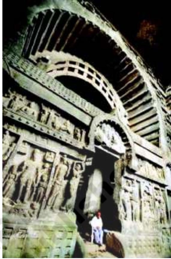
شکل 20.16 بیرونی دروازہ - غار میں چیتیا۔ کارلے

یہ کتاب حکومت آندھرا پردیش کی جانب سے مفت تقسیم کے لیے ہے