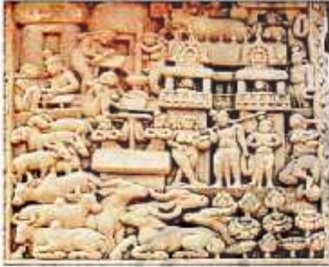
شکل 20.15 نیچے ساچی کی تختی پر دیہاتوں کی روزمرہ کی زندگی کی پیش کی گئی ہے

اس میں چھ شہزادوں اور ایک جام اُپالی کے سنگھا (جماعت) میں داخل ہونے والے منظر کو پیش کیا جا رہا ہے۔ گوتم بدھ نے شہزادوں کو انکساری کا درس دینے کے لیے اپنے اُپالی کو داخلہ دیا۔ گوتم بدھ کے بازو اُپالی ایک چھوٹی سی میز پر بیٹھا ہوا ہے۔ آپ دیکھ سکتے ہیں۔