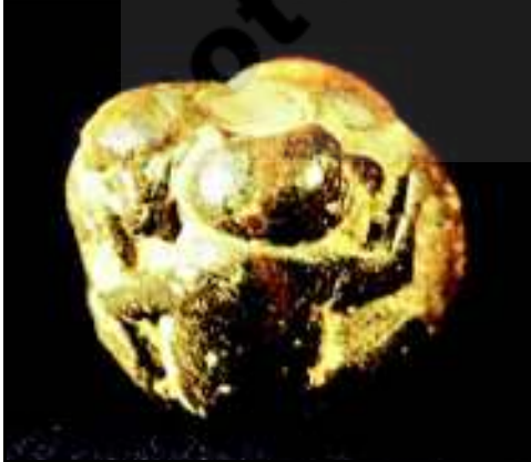
شکل 20.4 ٹھیکری پر ماتا دیوی کی تصویر