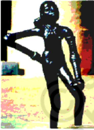
شکل 20.3 ایک ایستادہ لڑکی کے کانسہ کا مجسمہ

ماہرین آثار قدیمہ نے وادی سندھ کے قدیم ترین شہروں کی کھدائیاں کیں اور انہیں نفیس پتھر اور کانسے کے مجسمے ملے۔ اس کے علاوہ پتھروں پر کندہ کی گئیں مہریں اور پکی ہوئی چکنی مٹی کی تصویریں دریافت ہوئیں۔ وہ چار ہزار برس پرانی تھیں۔ آپ یہاں ان کی کچھ تصویریں دیکھ سکتے ہیں۔ اسے قدرتی انداز میں بنایا گیا ہے۔ ہمیں یہ نہیں معلوم کہ ان کا کیا مصرف تھا۔