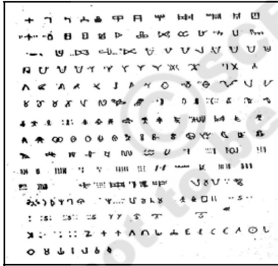
شکل 19.3 اپنی شکل - مختلف قسم کے رسم الخط

جب لوگ سفر کرتے ہیں اور ایک دوسرے سے گل مل جاتے ہیں ان کی زبانیں بھی ایک دوسرے سے مل جاتی ہیں اور لوگ ایک دوسرے کی زبان سے بہت سے الفاظ اپنالیتے ہیں۔ آج تلگو میں بہت سے الفاظ سنسکرت، مرٹھی، عربی، فارسی اور انگریزی کے ہیں۔