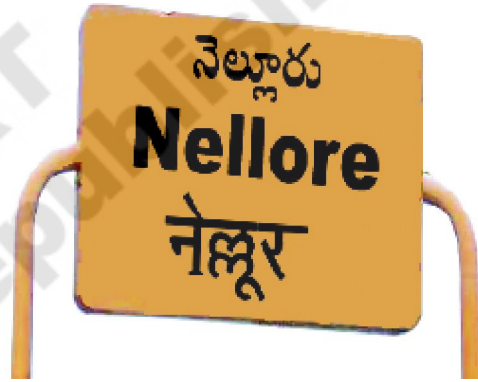
شکل 19.1 نام کی تختی۔ نیلور ریلوے اسٹیشن

♦ مختلف جانوروں، پرندوں یا بارش، کاروں یا ٹرکوں کی آواز کی نقل کرنے کی کوشش کیجیے۔ ہم کس قسم کی آوازیں نکالتے ہیں؟