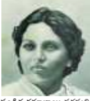
పండిత రమాబాయి సరస్వతి

తండ్రి చనిపోయిన తరువాత సోదరునితో కలిసి రమాబాయి దేశమంతా తిరిగింది. బెంగాల్లోని కోల్కతాకి కూడా వెళ్లింది. ఆమె పాండిత్యానికి గుర్తింపుగా ఆమె పండిత రమాబాయి సరస్వతిగా పిలవబడేది.