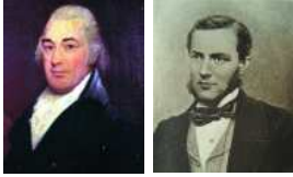
విలియం జోన్స్ మార్క్ ముల్లర్

కాబట్టి వాళ్ళను 'ప్రాచ్యపండితులు' అనేవారు.) ప్రస్తుతం ఈ పుస్తకాలు అందరూ చదువుకోటానికి అందుబాటు లోకి వచ్చాయి.