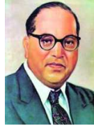
డాక్టర్ డి.ఆర్. ఆంబేద్కర్

పై చదువులకు అతడు అమెరికా, ఇంగ్లండ్ దేశాలకు వెళ్లారు. భారతదేశానికి తిరిగి వచ్చిన తరువాత న్యాయవాది వృత్తి చేపట్టారు. డివర్షులుగా పనిచేశాడు. 1927లో