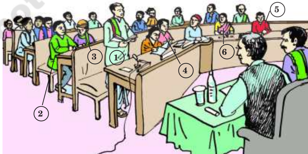
చిత్రం - 18.4

మంత్రి : మాన్యు అధ్యక్షా! ప్రజల ఆరోగ్యంమీద ప్రభుత్వానికి చాలా శ్రద్ధ ఉంది. కరువు పీడిత మండలాలలో నివారణ చర్యలను, జలరక్షణ చర్యలన్నిటినీ తీసుకుంటోంది. చెరువులను అభివృద్ధిచేయడం, చెట్లు నాటించడం, అక్రమ ఇసుక తవ్వకాలను నిషేధించడం వంటి చర్యలను తీసుకున్నాం. గౌరవసభ్యుల సూచనలన్నిటినీ పరిగణనలోకి తీసుకుంటాం. అలాగే ఈ పథకాలన్నీ సక్రమంగా అమలుచేయడానికి గౌరవ సభ్యుల మద్దతును కూడా కోరుతున్నాం.