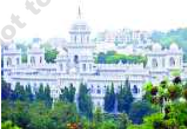
చిత్రం - 18.1 ఆంధ్రప్రదేశ్ అసెంబ్లీ భవనం

ఇప్పుడు మనకు రాజులు, యోధులు లేరు. 60 ఏళ్ల క్రితమే మనం బ్రిటిష్ వారి నుండి స్వాతంత్ర్యం పొందాం. మనల్ని మనం ఎలా పరిపాలించుకుంటున్నాం? పార్లమెంట్ సభ్యులు, శాసనసభ్యులు, ముఖ్యమంత్రులు, మంత్రులు, ఉన్నతాధికారుల గురించి మీకు తెలిసే ఉంటుంది. వారు ప్రాచీన కాలం నాటి రాజుల వంటి వారా? వారు వారికి ఇష్టమైనవి చేస్తారా? చేయరు. ఆధునిక ప్రభుత్వాలు చట్టాల ప్రకారం నడుస్తాయి. చట్టాలకు ఎవరూ అతీతులు కారు. చట్టాలకనుగుణంగా మంత్రులు, అధికారులు, వ్యవహరించాలి. కాని ఆ చట్టాలను ఎవరు, ఎలా తయారుచేస్తారు? అవి పాలకుల కోరికల ప్రకారం తయారౌతాయా? కాదు. వాటిని శాసనసభ్యులు, పార్లమెంట్ సభ్యులు చేస్తారు. ఈ సంస్థలు చట్టాలు ఎలా తయారుచేయాలో భారతరాజ్యాంగం సూచిస్తుంది. ఈ రాజ్యాంగ నియమాల ప్రకారమే చట్టాలు తయారుచేస్తారు. ఈ పాఠంలో రాష్ట్ర శాసనసభలో చట్టాలు ఎలా తయారుచేస్తారో విపులంగా చదువుదాం.