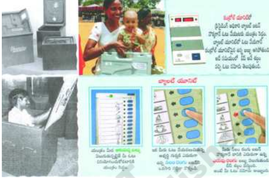
చిత్రం - 18.3

ఎన్నికల రోజున ప్రజలు ఒకరి తరవాత మరొకరు ఓటు వేస్తారు. పోలింగ్ బూత్ అధికారి ఓటర్ల గుర్తింపు కార్డు (Identity Card) పరిశీలిస్తారు. సాధారణంగా ఓటర్లందరికీ ఎన్నికల కమీషన్ గుర్తింపు కార్డులను జారీచేస్తుంది. ఈ కార్డులను ఆ అధికారికి చూపించాలి. ఓటర్లు తాము ఎవరికి ఓటువేసేది చెప్పగూడదు. ఓటు చాలా రహస్యంగా వేయాలి.