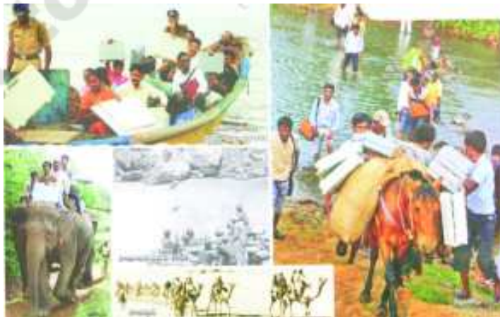
చిత్రం - 18.2

◆ ఎన్నికల కమిషన్ ప్రచురించిన కేలెండరులో ముద్రించిన చిత్రాలు 18.2, 18.3లో ఉన్నాయి. అవి దేశంలో విభిన్న కాలాలలో ఎన్నికలకు సంబంధించిన విభిన్న అంశాలను తెలియజేస్తున్నాయి. దీని ఆధారంగా గత కొన్ని సంవత్సరాలనుండి వస్తున్న మార్పులను మీ తల్లిదండ్రులతోను, ఉపాధ్యాయులతోను చర్చించండి.