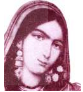
बेगम हज़रत महल

वीर कुँवर सिंह के बचपन के बारे में बहुत अधिक जानकारी नहीं मिलती। कहा जाता है कि कुँवर सिंह का जन्म बिहार में शाहाबाद ज़िले के जगदीशपुर में सन् 1782 ई. में हुआ था। उनके पिता