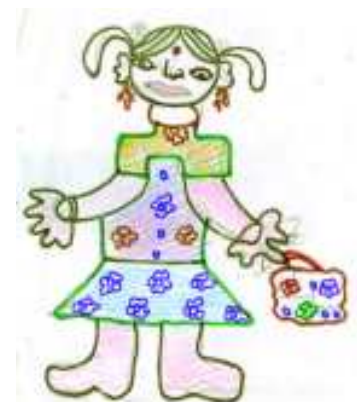
మీ వయస్సున్న పిల్లలు గీసిన చిత్రాలు