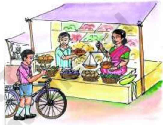
చిత్రం 15.1 కూరగాయలు కొనడానికి దుకాణం ముందు నిలబడి ఉన్న బడి పిల్లవాడు

కూరగాయల సుమన్, ఆ పిల్లవాడిని ఏమి కావాలని అడిగాడు. స్కూల్ యూనిఫామ్ లో ఉన్న ఆ పిల్లవాడు బెండకాయలు అర కిలో అని అన్నాడు. 'బోలేతో భేండీ ఆదా కిలో' అని కూరగాయల సుమన్ అన్నాడు. ఔసంటూ స్కూల్ యూనిఫాంలోని పిల్లవాడు తల ఊపాడు. తరవాత డబ్బులు చెల్లించి కూరగాయలు కొనుక్కొని సైకిల్ మీద ఇంటికి వెళ్ళిపోయాడు.