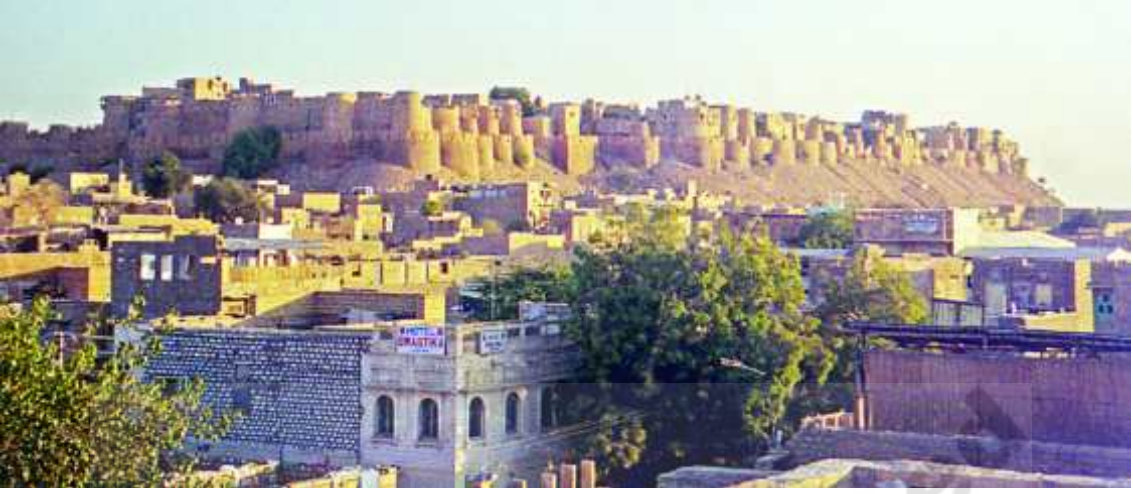
చిత్రం 15.3 జైసల్మేర్ కోట

ఈ ప్రదేశం ఎడారి ప్రాంతమైనప్పటికీ ఇరాన్ నుంచి ఆఫ్ఘనిస్తాన్ కు వచ్చేవారు లేదా ఆ దేశాలకు వెళ్ళే వర్తకులు ఈ ప్రాంతం గుండానే వెళతారు. వారికి అనువైన ప్రాంతాలలో ఇక్కడ విడిది చేస్తారు. అందువల్ల క్రమంగా ఈ ప్రాంతంలో జైసల్మేర్, బికనేర్, జోధ్ పూర్ వంటి ముఖ్యమైన పట్టణాలుగా ఎదిగాయి. వర్తకులతోపాటు గుజరాత్ లోని ద్వారకా, రాజస్థాన్ లోని అజ్మీర్ పుష్కర్ సరస్సును, అరబ్ లోని మక్కా మదీనాను, సందర్శించే యాత్రికులు ఈ ప్రాంతంనుంచే వెళతారు. ఈ విధంగా శతాబ్దాలకు పైబడి వివిధ మతాలకు చెందిన ప్రజలు, అంటే బౌహరా ముస్లిములు, సున్నీ ముస్లిములు, షియా ముస్లిములు, జైనులు, శైవులు, వైష్ణవులు, సిక్కులు ఇక్కడి పట్టణాలు, గ్రామాలలో స్థిరపడ్డారు. ఇంకోవైపు అనేకమంది మార్వాడి వర్తకులు ఇక్కడి నుంచి దేశంలోని వివిధ ప్రాంతాలకు వెళ్ళి అక్కడే స్థిరపడ్డారు. దాదాపు 50 సంవత్సరాల క్రితం ధార్ ఎడారి ప్రాంతానికి నీరు తీసుకురావటానికి పంజాబ్ లోని నదులనుంచి ఒక పెద్దకాలువ నిర్మించారు. ఈ కాలువ వెంబడి నూతన, సంపన్న గ్రామాలు వెలిశాయి. పంజాబ్, హర్యానాల నుంచి అనేక మంది ప్రజలు వచ్చి ఈ నూతన గ్రామాలలో స్థిరపడ్డారు.