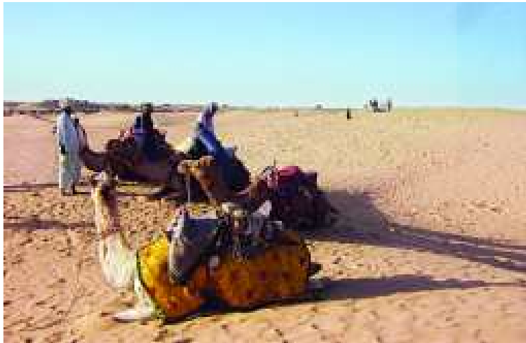
చిత్రం 15.2 థార్ ఎడారి

భారతదేశం పాకిస్తాన్ సరిహద్దు ప్రాంతంలో థార్ ఎడారి ఉంది. దానిలోని చాలాభాగం రాజస్థాన్ రాష్ట్రంలోని మార్వార్ ప్రాంతంలో ఉంది. ఈ ప్రాంతంలో వర్షపాతం చాలా తక్కువ. పెద్ద నదులు లేవు. ఫలితంగా చెట్లు తక్కువగా పెరుగుతాయి. గడ్డి మాత్రమే పెరుగుతుంది. ఇక్కడ ప్రజలు గొర్రెలను, మేకలను, ఒంటెలను మేపడంమీద ఆధార పడతారు. వీరు జంతువులకు తాగటానికి, కొంత వ్యవసాయానికి నీటిని నిలవ చేయటంలో అత్యంత జాగ్రత్త వహిస్తారు. సాధారణంగా గొర్రెల కాపరులు అనేక రాష్ట్రాలకు (రాజస్థాన్, హర్యానా, పంజాబ్, ఉత్తరప్రదేశ్, మధ్యప్రదేశ్, మహారాష్ట్ర, గుజరాత్) వాళ్ళ పశువులతో సహా వెళతారు; వర్షాకాలానికి ముందే థార్ కు తిరిగి చేరుకుంటారు. వీరు మేకలను, గొర్రెల ఉన్నిని అమ్ముతూ జీవనాన్ని గడుపుతారు.