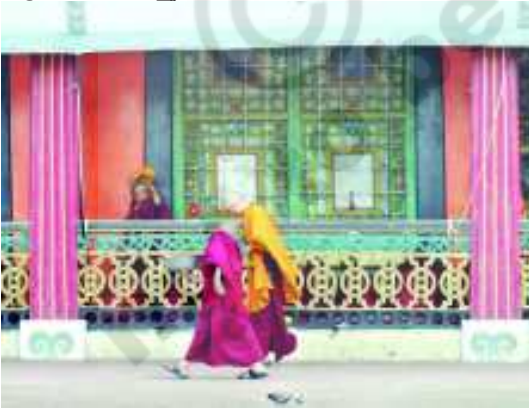
చిత్రం 15.5. రూమ్ బెక్ మఠం

వర్షపాతం ఉంటుంది. లోయల గుండా అనేక నదులు ప్రవహిస్తాయి. ఇక్కడి ప్రజలు పర్వతపు వాలు ప్రాంతాలను చదును చేసి ఏర్పాటుచేసిన మెట్లలాంటి మడులలో మొక్కజొన్న, వరి, గోధుమలు, ఏలకులు, అల్లం వంటి పంటలను పండిస్తారు. వారు టీ తోటలను, నారింజ తోటలను కూడా పెంచుతారు. పాలు, మాంసం, ఉన్ని కోసం గొర్రెలను, జడల బర్రెలను పోషిస్తారు.