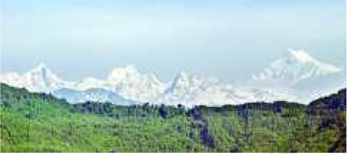
చిత్రం 15.4. కాంచనజంగా

వర్షపాతం ఉంటుంది. లోయల గుండా అనేక నదులు ప్రవహిస్తాయి. ఇక్కడి ప్రజలు పర్వతపు వాలు ప్రాంతాలను చదును చేసి ఏర్పాటుచేసిన మెట్లలాంటి మడులలో మొక్కజొన్న, వరి, గోధుమలు, ఏలకులు, అల్లం వంటి పంటలను పండిస్తారు. వారు టీ తోటలను, నారింజ తోటలను కూడా పెంచుతారు. పాలు, మాంసం, ఉన్ని కోసం గొర్రెలను, జడల బర్రెలను పోషిస్తారు.