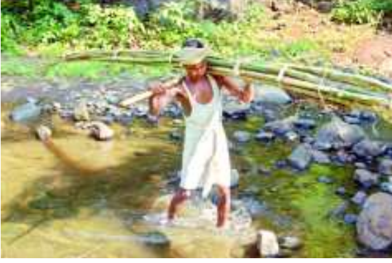
చిత్రం 6.16 వెదురు తెచ్చుకోడం

ఉత్పత్తుల సేకరణలో కూడా కలిసి పనిచేస్తారు. మగవారు, ఆడవారు అనే భేదం లేకుండా అన్ని పనులను వాళ్ళు కలిసి చేస్తారు. ముఖ్యంగా మగవారు వ్యవసాయం, పశువుల పెంపకంలో, ఆడవారు, పిల్లలు అడవులనుండి ఆహార సేకరణలో, బుట్టలు అల్లడంలో ఎక్కువగా పనిచేస్తారు.