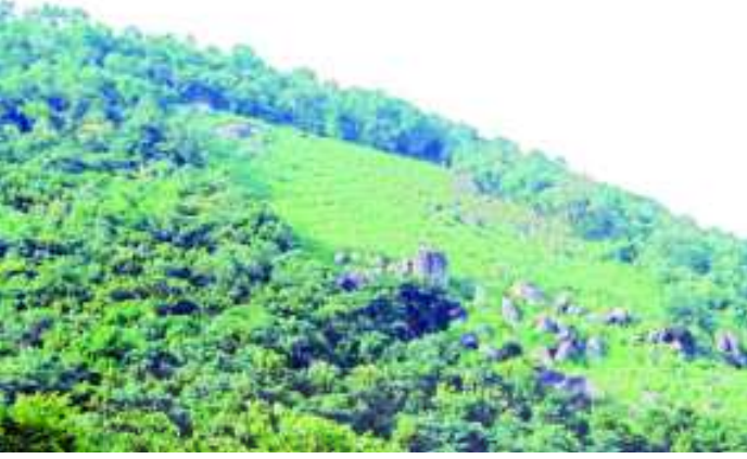
చిత్రం 6.4 అడవుల నరికివేత