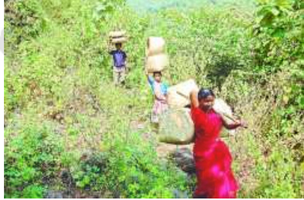
చిత్రం 6.15 బుట్టల అమ్మకానికి బయలుదేరడం

ప్రతి ఆవాస ప్రాంతంలో ఏడెనిమిది గుడిసెలు ఉంటాయి. అటువంటి ఆవాసప్రాంతాలు పది వరకు కొండమీద ఉన్నాయి. మొత్తంమీద 528