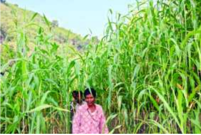
చిత్రం 6.6 పోడు పొలాల్లో పంటలు

లేకుండానే సాగు చేస్తారు. వీరి వ్యవసాయం వర్షాధారమే. దీని ద్వారా వీరికి ఆరు నెలల పాటు ఆహారం లభిస్తుంది.