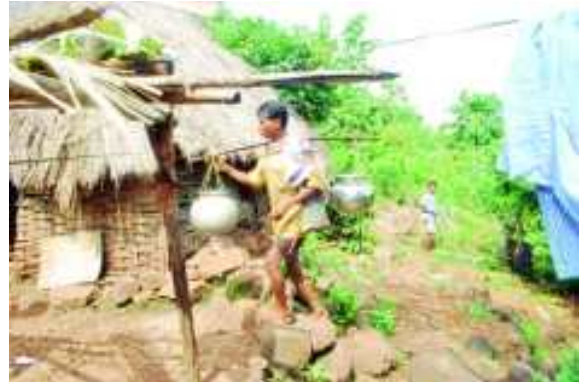
చిత్రం 6.12 కావిడతో నీళ్లు తెచ్చుకొనటం