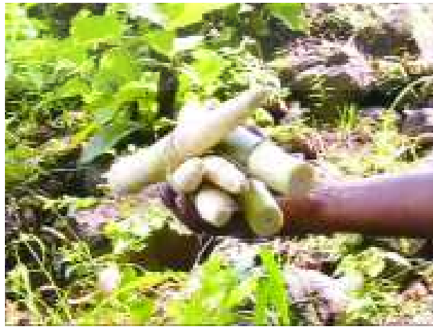
చిత్రం 6.9, 6.10 వెదురు కరికొమ్ములు సమకూర్చుకోడం