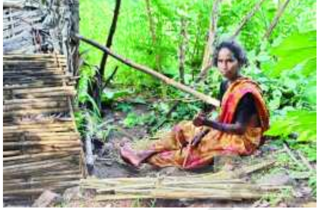
చిత్రం 6.20 బుట్టలు అల్లడం కోసం వెదురును చీల్చడం

గిరిజనులు పోడు వెదురు పెరటితోట అటవీ ఉత్పత్తులు ఆచారాలు