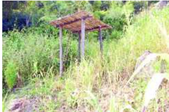
చిత్రం 6.7 పోడు పొలాల్లో మంచె

వీరు సంవత్సరంలో వివిధ ఋతువులలో వివిధ రకాల పళ్లు, దుంపలు, గింజలు, ఆకుకూరల సేకరణ, చిన్న జంతువుల వేట వీరి ప్రత్యేకత.