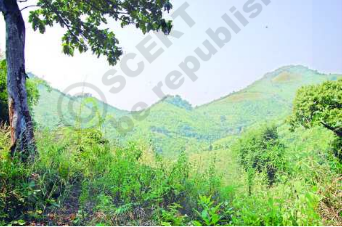
చిత్రం 6.1 బైసన్ కొండల ఉపరితలం

మనం తీరమైదానాలు, వర్షాధార పీఠభూములలోని జీవన విధానాన్ని గత పాఠాలలో చదివాం. ఈ పాఠ్యాంశంలో వేరొక విభిన్నమైన జీవన విధానాన్ని గూర్చి తెలుసుకోబోతున్నాం. అదే కొండ ప్రాంతం. మీరెప్పుడైనా ఏదైనా కొండప్రాంతంలో జీవించారా? లేదా ఏదైనా అటువంటి ప్రాంతానికి వెళ్ళారా? కొండను వర్ణించగలరా? అక్కడ నీవేమి చూసావు? ఆ ప్రాంతంలోని ప్రజలు ఎలాంటి పనులు చేస్తారు?