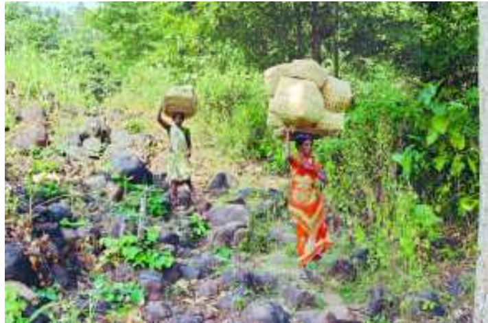
చిత్రం 6.3 కూనవరం గ్రామానికి దారి

వారి జీవితాల గురించి తెలుసుకోవడం కోసం మేం వారితో మాట్లాడినాము. వారు తెలుగులో మాట్లాడారు. దానితో మాకు వారితో సంభాషించడం సులువయింది.