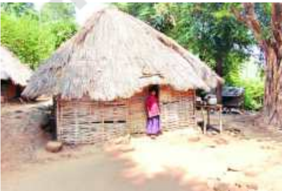
చిత్రం 6.17 వెదురుతో ఇళ్ళ నిర్మాణం

కొండరెడ్లు ప్రకృతి దేవతలను ఆరాధిస్తారు. ప్రతి కుటుంబానికి ప్రత్యేకంగా కులదేవత ఉంటుంది. వారి ఇంటిముందు పొడవైన కర్రను పాతి, కొన్ని వేప మండలు కడతారు. దీన్ని ముత్యాలమ్మగా భావించి ఆరాధిస్తారు. మగవారు మాత్రమే అడవికి వెళ్లి అడవి దేవతలను పూజిస్తారు. వారి పండుగలు కాలాలను సూచిస్తాయి. మామిడి పండుగ, గోంగూర పండుగ వంటివి జరుపుతారు. అన్నిటికంటే మామిడి పండుగ ప్రధానమైనది. గోంగూర పండుగ సెప్టెంబర్ నెలలో