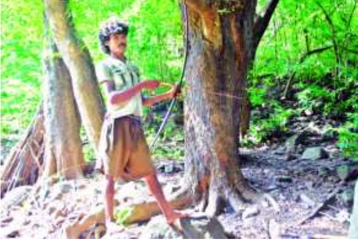
చిత్రం 6.8 బాణాలతో వేట

పంట కోతల తర్వాత గిరిజన మహిళలు, పిల్లలు ఆహారంగా పనికొచ్చే అటవీ ఉత్పత్తులను సేకరిస్తారు. వెదురు బొంగుల చిగుళ్ళు, తేనె వీరు సేకరించే రెండు ముఖ్యమైన అటవీ ఉత్పత్తులు. వెదురు బొంగుతో చేసిన నిచ్చెనతో పెద్దచెట్లను ఎక్కి తేనెను సేకరిస్తారు. 'కరి కొమ్ములు' అనే లేత వెదురు చిగుళ్ళను వెదురు పొదలనుంచి సేకరిస్తారు. ఈ చిగుళ్ళ పై పొరను తీసి దీన్ని వండుతారు. ఇది ఎంతో రుచికరమైన వంటకంగా వారు భావిస్తారు.