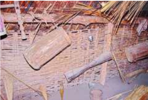
చిత్రం 6.14 వెదురు గృహోపకరణాలు, వాయిద్యపరికరాలు 56 సాంఘికశాస్త్రం

మంది జనాభా కలిగి ఉన్న 78 కుంటుంబాలవాళ్ళు ఇక్కడ జీవిస్తున్నారు. వీరంతా చిన్న గ్రామాలలో ఉంటున్నారు. ఈ ఆవాస ప్రాంతాలు శాశ్వతం కావు. ఎప్పుడైనా అంటువ్యాధులు ప్రబలితే ఆ ఆవాస ప్రాంతం విడిచిపెట్టి వేరొక చోట గుడిసెలు వేసుకుంటారు.