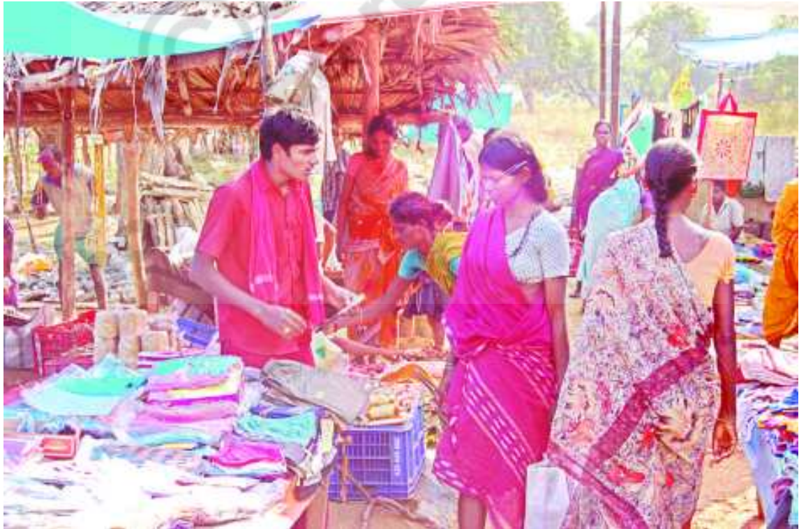
చిత్రం 6.19 కూతురు పల్లెలో ఉన్న సంత

గోదావరి నదికి పోలవరం దగ్గర పోలవరం ప్రాజెక్టు నిర్మాణం చేపట్టారు. ఇక్కడి డ్యాంలో నిలవ చేసే నీటి వల్ల కూనవరం మండలంలోని చాలా గ్రామాలు మునిగిపోయే అవకాశం ఉంది. ఈ ప్రాజెక్టు వల్ల కృష్ణ, గోదావరి డెల్టా గ్రామాలకు నీటిపారుదల సౌకర్యం కలుగుతుంది. ఇటువంటి పరిస్థితులలో కొండరెడ్డు కొండలమీద నివసించడం చాలా కష్టం.