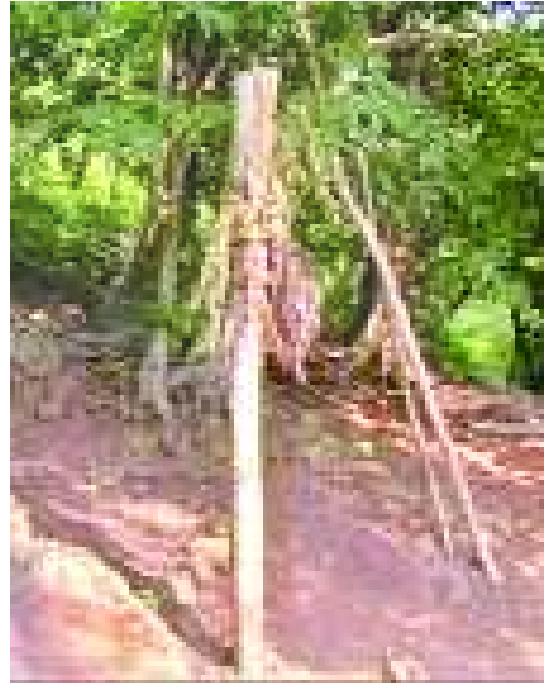
చిత్రం 6.18 ముత్యాలమ్మ దేవత

కొండరెడ్ల జనాభా సంఖ్యాపరంగా తక్కువ. వారి జీవన విధానం చాలా భిన్నమైనది, పురాతనమైనది. వారి జీవన విధానం ప్రకృతికి అనుకూలంగా ఉంటుంది. దుక్కి వ్యవసాయం, ఖనిజాల వెలికితీత, పరిశ్రమలు, ఉత్పాదకత, పట్టణ జీవనంతో పోలిస్తే వీళ్ళు పర్యావరణానికి అతి తక్కువగా నష్టం కలుగజేస్తారు. వీళ్ళ జీవితం పూర్తిగా అడవిమీద ఆధార పడుతుంది. అయినా వారు అడవులను నాశనం చేయరు. పోడు వ్యవసాయానికి అడవులను నరికినా,