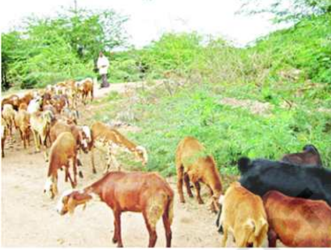
చిత్రం 5.10 : గొర్రెల పెంపకం

సలకంచెరువులో కొంతమంది రైతులు పాలకోసం ఆవులు, గేదెలు పెంచుతున్నారు. గ్రామంలో ఐదు,