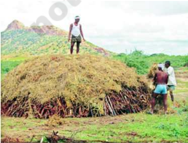
చిత్రం 5.11 : బొగ్గుబట్టీల ఏర్పాటు

ఆంధ్రప్రదేశ్ ప్రభుత్వం వారిచే ఉచితపంపిణీ