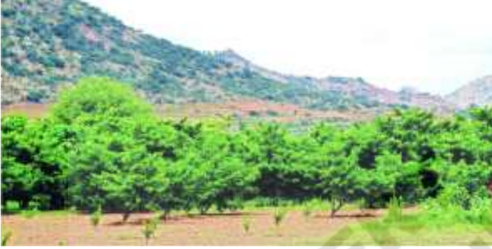
చిత్రం 5.7 : సపోటా, నిమ్మ తోటలు

నీటిసమస్యవల్ల కొందరు రైతులు సపోటా, నిమ్మవంటి తోటలను పెంచాలని భావించారు. ఈ పండ్లతోటలకు కేవలం కొంతకాలం నీటి సౌకర్యం కల్పిస్తే అవి సంవత్సరాల తరబడి పండ్లనిస్తాయి.