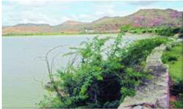
చిత్రం 5.4 : సలకంచెరువుకు వెళ్ళే దారిలో ఉన్న సింగనమల చెరువు