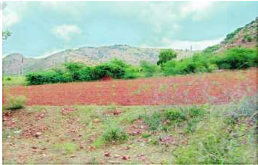
చిత్రం 5.3 : కొండ చరియలలో రాళ్ళతో కూడిన ఎర్రనేలలు

కొండల వాలు కింద పొలాలున్నాయి. అందువల్ల చాలా వరకు రాళ్ళు దొర్లి పొలాల్లో పడుతుంటాయి. ఇక్కడ మట్టి ఎర్రరంగులో ఉంటుంది. కాని అది రెండు మూడు అడుగుల లోతు వరకు మాత్రమే ఉంటుంది. ఈ నేలలు తక్కువ సారవంతమై, తక్కువ తేమను మాత్రమే నిలవ