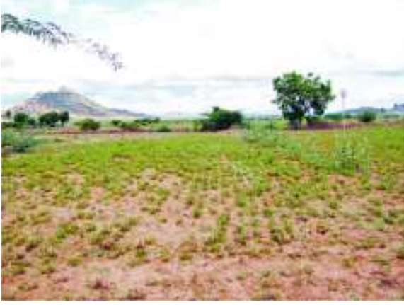
చిత్రం 5.5 : కరవువల్ల దెబ్బతిన్న వేరుసెనగ పంట

ఆగస్టులో వస్తే వారు జొన్న కందిపంట వేస్తారు. అక్టోబరు, నవంబరు మాసాల్లో తిరిగి వానలు కురిస్తే వేరుసెనగ పంట బాగా పండుతుంది. లేకపోతే వేరుసెనగ పంట ఎండిపోతుంది.