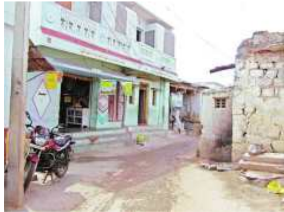
5.14 : వీధిలో ఉన్న కొత్త, పాత ఇళ్లు

పూర్వకాలంలో పాత ఇండ్ల నిర్మాణంలో కర్రను ఎక్కువగా ఉపయోగించగా, కొత్త ఇండ్లకు ఉక్కు, ఇటుకలు, కాంక్రీటులను వినియోగించారు. చాలా వరకు ఇళ్లు రాళ్ళు, బురద మట్టితో నిర్మితమైనవి. చుట్టుపక్కల గల రాతి గనులలో సులభంగా రాళ్ళు లభించడం దీనికి కారణం. పేదప్రజలు పూరిగుడిసెలు, రేకు ఇళ్ళలో నివసిస్తున్నారు. ఇది విద్యుదీకరణ చెందిన గ్రామం. గతంలో సలకంచెరువు ప్రజలు తాగే నీటికోసం బావుల మీద ఆధారపడేవారు. ప్రస్తుతం అక్కడ ఒక ఓవర్ హెడ్ టాంక్ (రక్షిత మంచినీటి పథకం) ద్వారా తాగునీరు సరఫరా చేస్తున్నారు. ఒక బోరు పంపు ద్వారా నీటిని ట్యాంకులో నిల్వ చేస్తున్నారు. ప్రతీ రెండు రోజుల కొకసారి నీటిని కుళాయిల ద్వారా సరఫరా చేస్తున్నారు.