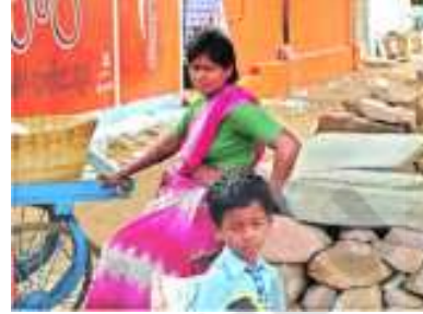
5.15 : ఊరిలో ఉన్న చిన్న కిరాణి కొట్టు