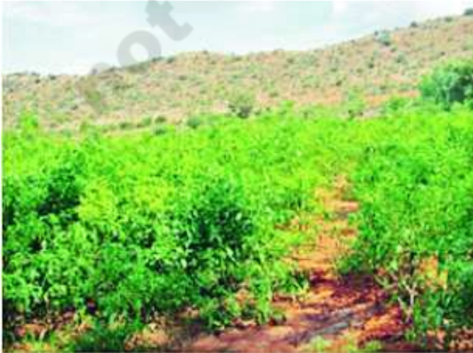
చిత్రం 5.8 : బోరుబావి ద్వారా పెంచిన మిరప పంట