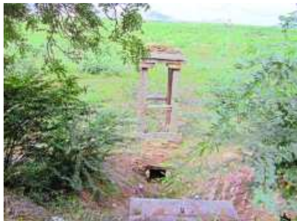
చిత్రం 5.1 : ఎండిపోయిన సలకంచెరువు

చాలా కొండలు, బండలు, రాళ్ళు దాటిన తరవాత మేం చివరకు సలకంచెరువు చేరుకున్నాం. ఇది అనంతపురానికి ఈశాన్యం దిశగా 30 కి.మీ దూరంలో గల సింగనమల మండలంలో ఉంది. ఆ ఊరిలో ఉన్న చెరువు పేరుమీదే ఈ ఊరిని సలకంచెరువుగా పిలుస్తున్నారు. పడమర, ఉత్తర, దక్షిణ వైపుగా ఉన్న కొండలలో కురిసిన వర్షం ఈ చెరువులోకి చేరుతుంది. అయితే ఈ చెరువు ఈ రోజు ఎండిపోయి ఉంది. పల్లె ప్రజలు మాతో చెప్పినదాన్ని బట్టి ఈ చెరువు 20 సంవత్సరాలుగా ఎండిపోయి ఉందని తెలిసింది.