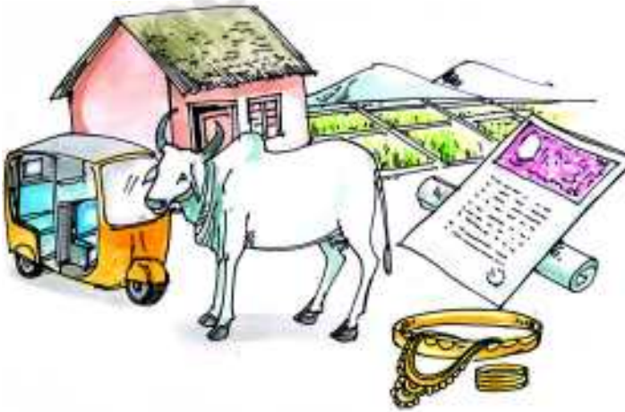
చిత్రం 19.2: పూచీకత్తుగా ఉపయోగించే స్థిర, చర ఆస్తులు

తీసుకోవడానికి పూచీకత్తుగా చూపించే వాటికి కొన్ని ఉదాహరణలు.