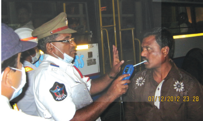
చిత్రం 24.1 : పోలీసులు ఏమి చేస్తున్నారు?

ఎవరైనా ఆల్కహాల్ తీసుకున్నట్లయితే అది రక్తంలో కలిసిపోయి, మన శరీరం మొత్తానికి రక్తం ద్వారా వ్యాపిస్తుంది. ఈ రక్తం ఊపిరితిత్తులలోకి చేరడం ద్వారా మనం విడిచిపెట్టే గాలిలో ఆల్కహాల్ క సంబంధించిన ఆనవాలును ఒక ఎలక్ట్రానిక్ పరికరం ద్వారా గుర్తించగలం. మనం విడిచిపెట్టే గాలిలో కార్బన్ డై ఆక్సైడ్ తో పాటుగా ఆల్కహాల్ ఆనవాలు కూడా ఉంటుంది. ఇది తక్కువ మోతాదులో ఉన్నప్పటికీ ఈ పరికరం గుర్తించగలదు. ఒకవేళ ఈ పరికరం ద్వారా పరీక్షించిన అనంతరం సంబంధిత అధికారులు నిందితులకు మేలు చేయాలని ప్రయత్నించినా ఆ పరికరంలో నమోదైన విషయాలను తొలగించే అవకాశం లేదు.