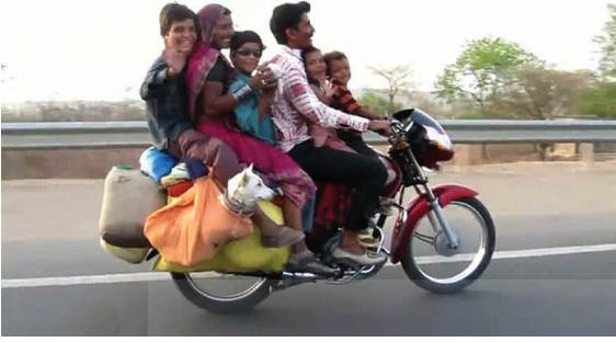
చిత్రం 24.2 : పరిమితిని మించిన ప్రయాణం - ప్రమాదకరం