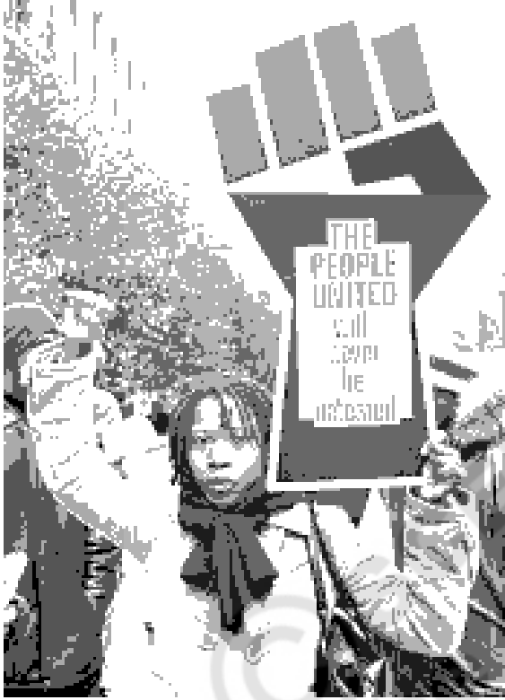
చిత్రం 19.1: ప్రజల నిరసన

ఇంతకు ముందు ఒక అధ్యాయంలో యూరపులో ప్రజాస్వామిక ప్రభుత్వాలకు దారితీసిన ప్రజాస్వామిక విప్లవాల గురించి చదివారు. ప్రజల ఆకాంక్షలు, అవసరాలకు అనుగుణంగా ఉండే ప్రభుత్వాలను - ప్రజలు స్వేచ్ఛగా, పూర్తిగా పాల్గొనగలిగే, ప్రజలందరికీ గౌరవప్రదమైన స్థానం దొరికే ప్రభుత్వాలను ఏర్పాటు చేయటం అనేది ఇంకా కలగానే ఉంది. ప్రపంచవ్యాప్తంగా ప్రజలు దీనికోసం ఇంకా పోరాడుతునే ఉన్నారు.