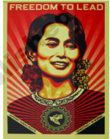
ఆంగ్ సాన్ సూకి: ప్రజాస్వామ్యానికి మద్దతుగా మయన్మార్లోని గోడపత్రిక

1990లో పాలకులు ఎన్నికలు ప్రకటించారు. సూకి జైలులో ఉండగానే, ఆమె నాయకత్వం వహించిన జాతీయ ప్రజాస్వామ్య కూటమి (నేషనల్ లీగ్ ఫర్ డెమోక్రసీ - ఎన్ఎల్డి) అన్న ఒక కొత్త పార్టీ ఈ ఎన్నికలలో అధిక శాతం (80%) సీట్లు పొందింది. అయితే సూకిని విడుదల చేయటానికిగాని, అధికారాన్ని అప్పగించటానికిగానీ సైన్యం సిద్ధంగా లేదు. ఆమెను గృహ నిర్బంధంలో కొనసాగించారు. ప్రజలతో కలవటానికి వీలు లేకుండా సూకిని ఆమె ఇంట్లోనే బందీగా ఉంచారు. భర్త అంత్యక్రియలలో పాల్గొనటానికి, తన ఇద్దరు కొడుకులను కలవటానికి కూడా ఆమెకు అనుమతి ఇవ్వలేదు.