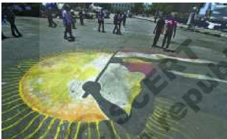
చిత్రం 19.2: ఈజిప్టులో వీధి చిత్రకళ, ఈ దశాబ్దంలో ప్రజాస్వామిక ఉద్యమాన్ని చూసిన మరొక దేశం ఇది

వేగవంతమైన ప్రగతి, పట్టణీకరణ, కొత్త ఉద్యోగాలు, ఆర్థిక అవకాశాల వల్ల నిదానంగా జాతుల జీవన విధానం అంతరించిపోసాగింది. పట్టణాలలో వివిధ జాతుల ప్రజలు కలసి జీవించసాగారు. చమురు నిల్వలు, వ్యాపారం, వాణిజ్యాలను మొత్తంగా నియంత్రించే ప్రభుత్వంలో ఉద్యోగ అవకాశాలు ఎక్కువగా ఉండేవి. వ్యాపారం, పరిశ్రమలను చేపట్టాలన్న ఆసక్తి ఉన్న కొత్త మధ్యతరగతి లిబియాలో ఏర్పడింది. ప్రభుత్వ విధానాలు, శక్తిమంతమైన కుటుంబాల ఆధిపత్యం వల్ల ఇటువంటి అవకాశాలు ఏవీ లేకుండా పోయాయి.