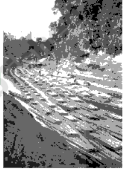
చిత్రం 18.2: చిట్టగాంగ్ అడవి ప్రాంతాలలో కాస్సాలాంగ్ నది వెంట కిందకి తరలిస్తున్న వెదురు

బ్రిటిషు పాలనలో ఈ పరిస్థితి మారింది. ఆ సమయంలో కోల్ కత, ముంబయి వంటి పెద్ద పట్టణాలు ఏర్పడుతున్నాయి. ప్రభుత్వం దేశవ్యాప్తంగా వేల కిలోమీటర్ల రైలు మార్గాలను నిర్మిస్తోంది. పెద్ద పెద్ద ఓడలను తయారు చేస్తున్నారు, గనుల తవ్వకం చేపట్టారు. వీటన్నిటికీ పెద్ద ఎత్తున కలప కావాలి, దాంతో కలప వ్యాపారం వేగంగా పెరిగింది.