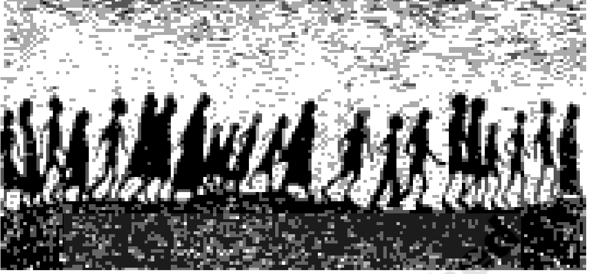
చిత్రం 18.7: మిల్లువైపుకి నడుస్తున్న పురుషులు, స్త్రీలు, పిల్లలు

కావటంతో పని ఆపవలసిన అవసరంలేదు. ప్రతి కార్మికుడితో రోజుకి 15 గంటలు పని చేయించుకోవటం సాధారణమై పోయింది.