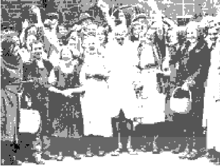
చిత్రం 18.9: 1931లో ఇంగ్లాండులోని లాంకోషైర్ లో మిల్లు కార్మికులు గాంధీజీని కలిసి భారతదేశ స్వాతంత్ర్య ఉద్యమానికి తమ సంఘీభావాన్ని తెలియచేశారు.

కార్మికుల సంక్షేమం కోసం చట్టాలు చేస్తే భారతదేశంలో పరిశ్రమలు అభివృద్ధి చెందవని ఇక్కడి విద్యావంతులు కూడా విశ్వసించసాగారు. 1875లో బెంగాల్ లోని దిన పత్రికలో ప్రచురితమైన కొన్ని వాక్యాలు ఆనాటి ఆలోచనను వ్యక్తపరుస్తాయి. “ఈ కొత్త పరిశ్రమలను నాశనం చేసేకంటే కార్మికులలో అధిక సంఖ్యలో మరణాలను కొనసాగనివ్వటం సరైనది... మన పరిశ్రమలు బాగా నిలదొక్కుకున్న తరువాత కార్మికుల ప్రయోజనాలను కాపాడవచ్చు.”