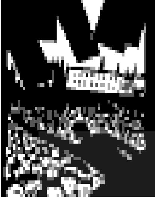
చిత్రం 18.8: కార్మికుల సమావేశాన్ని చూపిస్తున్న చిత్రం

అదేవిధంగా 1919లో జీవన వ్యయం పెరుగుతోంది కానీ కార్మికుల వేతనాలు మాత్రం పెరగటం లేదు. దాంతో ముంబయిలోని అన్ని కర్మాగారాల కార్మికులు సమ్మె చేయటం వల్ల 12 రోజులపాటు మిల్లులు పని చేయలేదు.