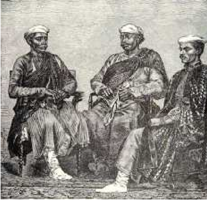
చిత్రం 18.5: ఢిల్లీలో తాలి నాటి బ్యాంకర్ల చిత్రం

వేగంగా విస్తరించాయి. భారతదేశంలోని కర్మాగారాలకు యూరపునుంచి యంత్రాలను దిగుమతి చేసుకుని కొత్త పరిశ్రమలు స్థాపించసాగారు. భవిష్యత్తులో కూడా భారతీయ సరుకులు పెద్ద సంఖ్యలో అమ్ముకోవడానికి విదేశీ వస్తువులపై పన్ను విధించాలని భారతీయ పారిశ్రామికులు ప్రభుత్వంపై తీవ్ర వత్తిడి తీసుకురాసాగారు.