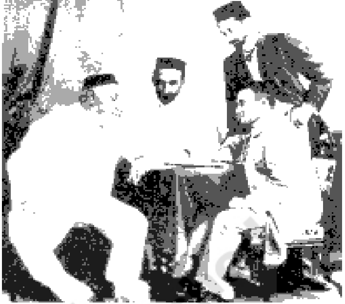
చిత్రం 18.6: భారతీయ పారిశ్రామికవేత్తలలో కొంతమంది: జె.ఎన్. టాటా, ఆర్.డి. టాటా, సర్ ఆర్.జె. టాటా, సర్ డి.జె. టాటా.

విదేశీ వస్తువులపై పన్ను రూపంలో ప్రభుత్వం నుంచి భారతీయ పారిశ్రామికవేత్తలకు లభించిన మద్దతు ముఖ్యమైనదే కాని అది మాత్రమే సరిపోదు. రైలుమార్గాలు, రోడ్లు, విద్యుత్తు, బొగ్గు, ఇనుము వంటి అనేక వనరులు, సౌకర్యాలు వాళ్లకి కావాలి. అయితే బ్రిటిషు ప్రభుత్వం ఈ రంగాలపై తగినంత దృష్టి నిలపలేదు.