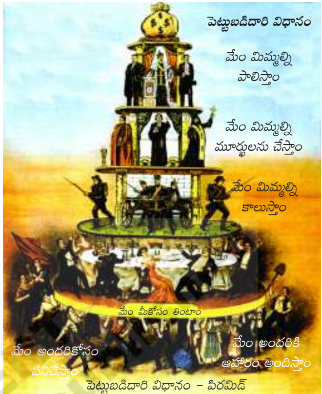
చిత్రం 16.3 కార్మికులను ప్రోత్సహించే విధంగా ఉన్న ఆనాటి పత్రిక లోని పోస్టర్

కర్మాగారాలలో ఉత్పత్తి చేసే కార్మికులకు ఎటువంటి ఆస్తిలేదు, కానీ ఉత్పత్తి జరగటానికి వాళ్లు ఎంతో కీలకం అని మార్క్స్, ఎంగెల్స్ లు వాదించారు. పెట్టుబడిదారీ విధానం లాభాలు గడించడానికి