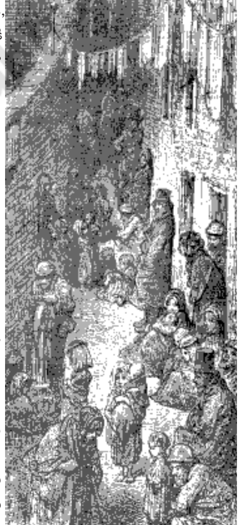
చిత్రం 16.1: లండన్లోని పేద ప్రజలు ఉండే వీధి. ఫ్రెంచి కళాకారుడు డోరే వేసిన బొమ్మ, 1876

పారిశ్రామికీకరణ వల్ల కొత్త సామాజిక బృందాలు కూడా ఏర్పడ్డాయి. సమాజంలో ముఖ్యపాత్ర పోషించటానికి ఇవి