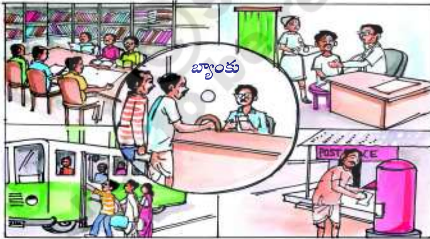
చిత్రం 11.1: ప్రభుత్వ కార్యకలాపాలు

సిలిండర్ల వంటి వాటికి రాయితీలు చెల్లిస్తుంది. ప్రస్తుతం ఈ రాయితీల సాఫల్యతపై చాలా చర్చ జరుగుతున్నది. ఈ రాయితీలు ప్రజలకు ప్రయోజనం కలుగజేస్తున్నాయా? వీటిని మెరుగుపర్చడానికి